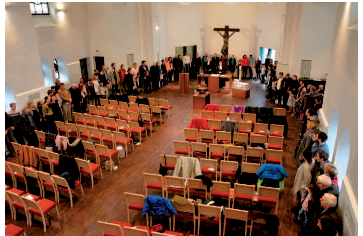
Abendmahl beim Schätzefest in der Christuskirche 2020

Danach trinken alle einen Schluck Wein oder Traubensaft oder die Hostie wird in den Kelch getunkt. Damit möglichst alle unterschiedslos und ungehindert teilhaben können, feiern wir in der Christuskirche seit einigen Jahren ausschließlich mit glutenfreien Hostien und Traubensaft. An anderen Gottesdienstorten können Sie zwischen Wein und Traubensaft und zwischen glutenhaltigen und -freien Hostien wählen.