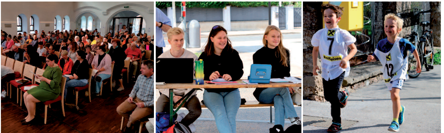
Text und Fotos: Werner Geißelbrecht, Jakob Dantine

Im Anschluss fand der jährliche Kirchenlauf statt. Auch heuer wurde wieder fleißig für einen guten Zweck gelaufen, spaziert, gerollert ... unzählige Runden wurden vollendet und damit die beachtliche Summe von 2.201,80 Euro erlaufen. Der Spendenerlös kam der „Tafel“ des Roten Kreuzes zugute, um Menschen zu unterstützen, denen die Teuerung das Leben momentan besonders schwer macht. Danke an alle Mitwirkenden fürs Organisieren, Laufen und Spenden!